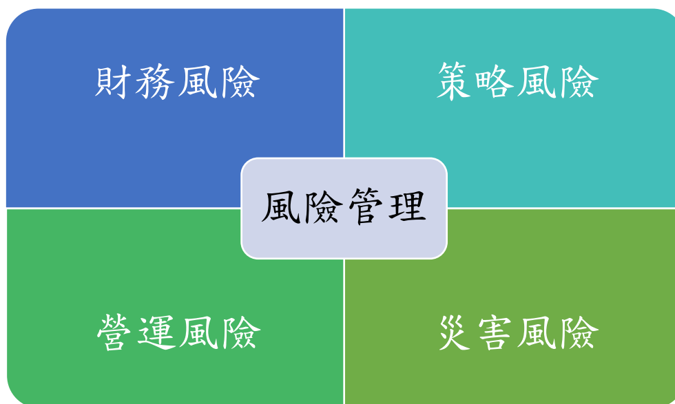
圖 3 風險管理範疇