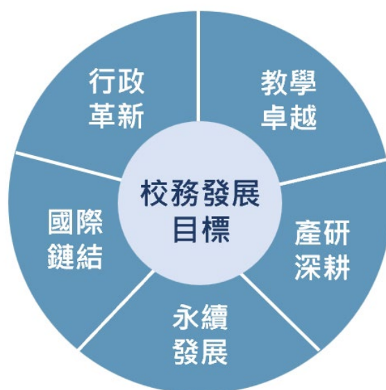
圖 1 本校校務發展目標

本校以「行政革新」、「教學卓越」、「產研深耕」、「永續發展」及「國際鏈結」五大校務發展目標為指引，持續透過各項執行策略全面推動校務發展。